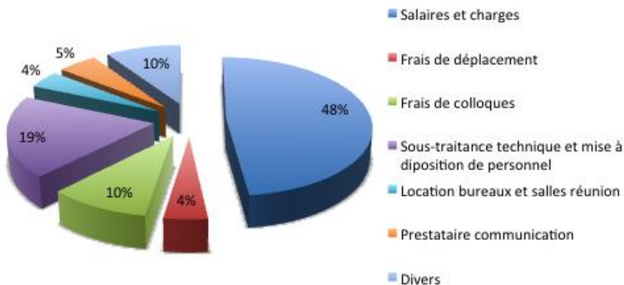
Répartition des charges d'exploitation

La reprise d'engagements réalisés (+11 840 euros) vient améliorer le résultat, alors que d'autres engagements (10 000 €) sont reportés à l'année 2017 et viennent donc pénaliser ce résultat.